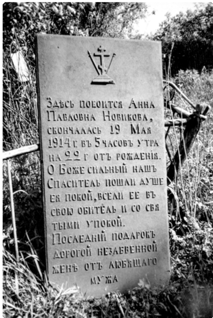
Чугунная надгробная плита с захоронения А.П. Новиковой.