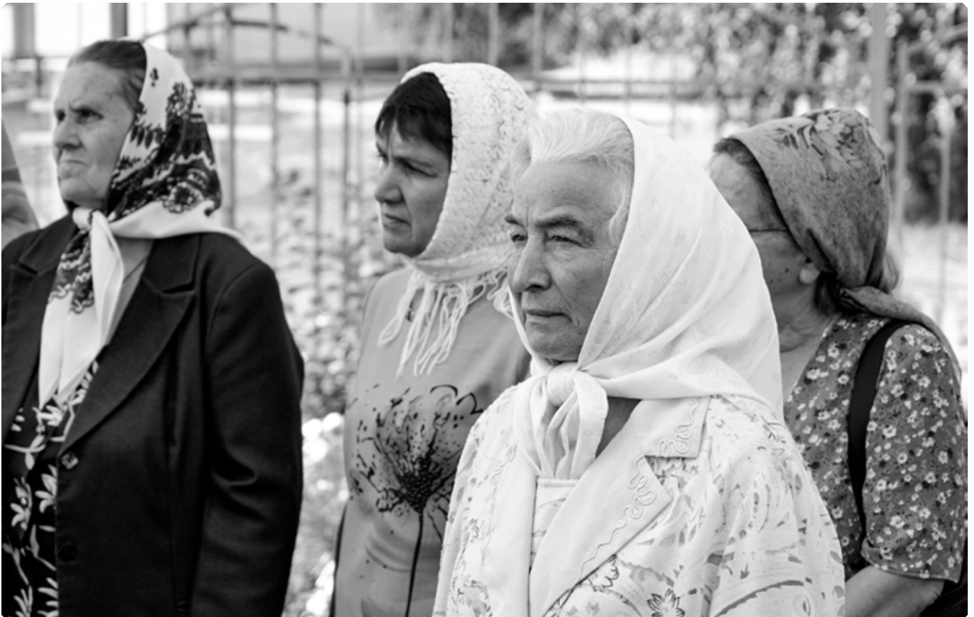
Прихожане Петропавловского храма на праздничном богослужении. Село Петропавловское. 12 июля 2024 г.