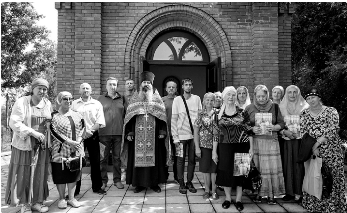
Участники молебна. Часовня Новомучеников и исповедников Церкви Русской. Город Бийск. 29 июля 2024 г.

При подготовке рубрики использованы материалы издания: Игумен Дамаскин (Орловский). «Жития новомучеников и исповедников Церкви Русской. Июль. Ч. 1». Тверь. 2016. С. 332–353.