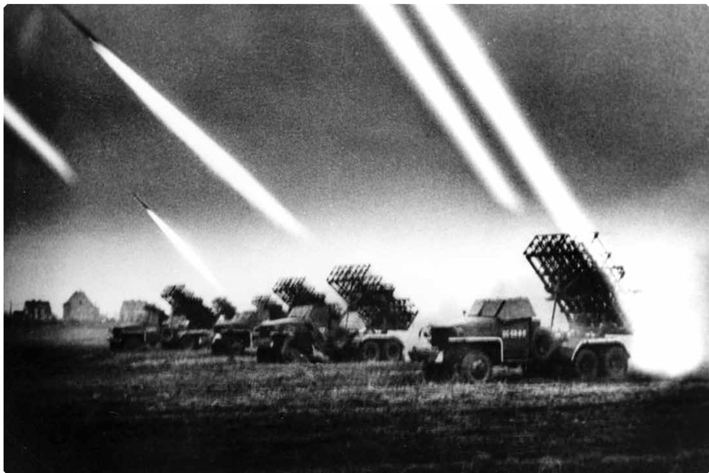
Залп гвардейских реактивных минометов во время штурма Бреслау. Германия. 1945 год.