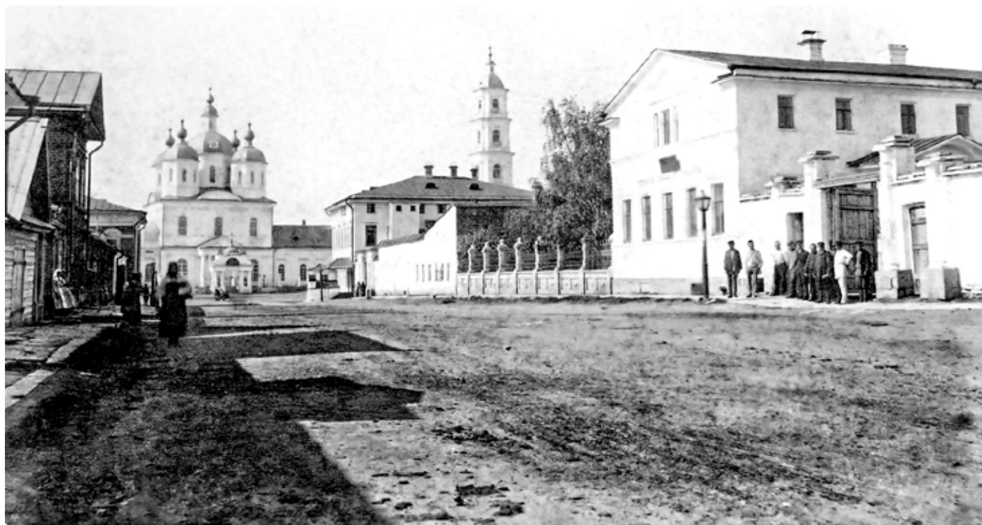
Вятская губерния. Город Елабуга. Улица Спасская. 1910 г.

Не странное ли явление: сам отец не жалеет свое семейство, пропивает его достояние, позорит