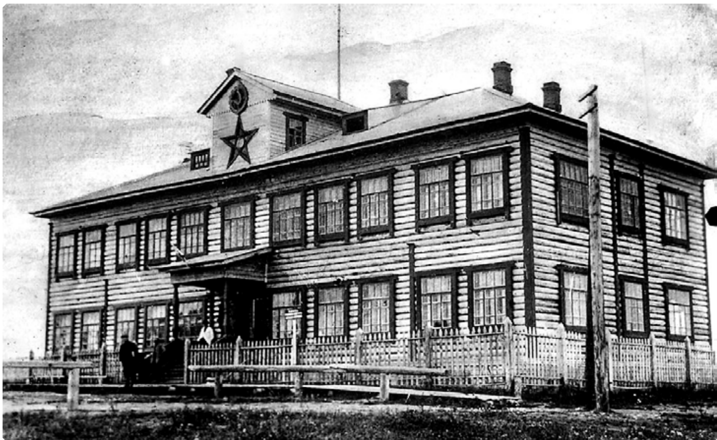
Здание участковой поселковой комендатуры Место съёмки: Нарымский округ Западно-Сибирского края

Ну, слава Богу, маленько успокоился. Девчат моих сон одолел, они заснули, а я сижу, меня сон не берёт. Сижу и думаю, то ли из тайги выйду, то ли останусь здесь навсегда? Возложила всю надежду на Господа Бога, свалилась между девчатами и заснула.