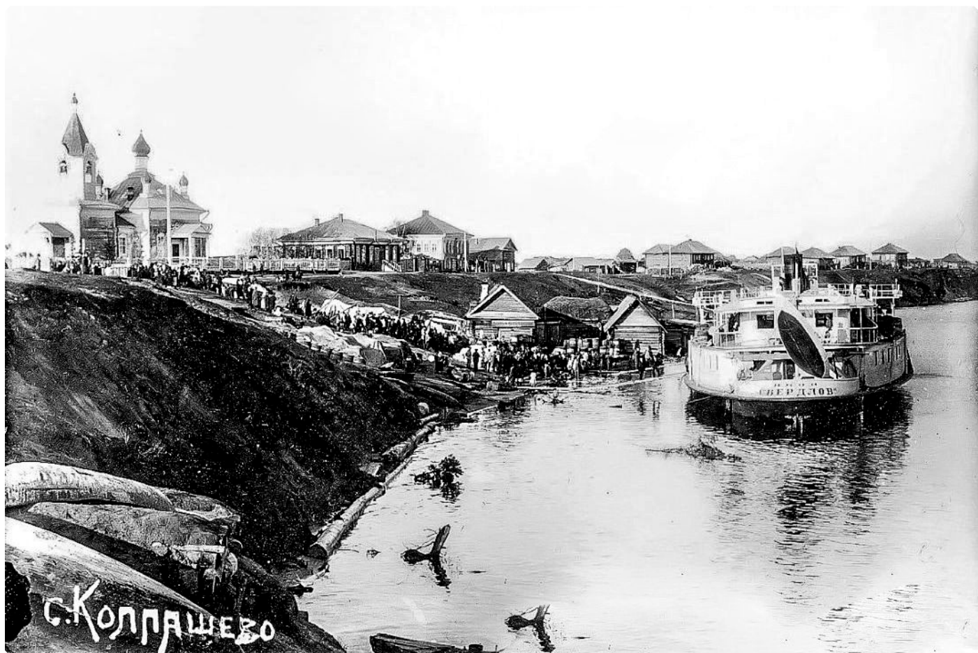
Пароход на пристани села Колпашево. На берегу – Петропавловская церковь. 1930-е годы. ТОКМ. Источник изображения: https://tomskmuseum.ru/

От редакции. Орфография и пунктуация текста оригинальной рукописи сохранены.