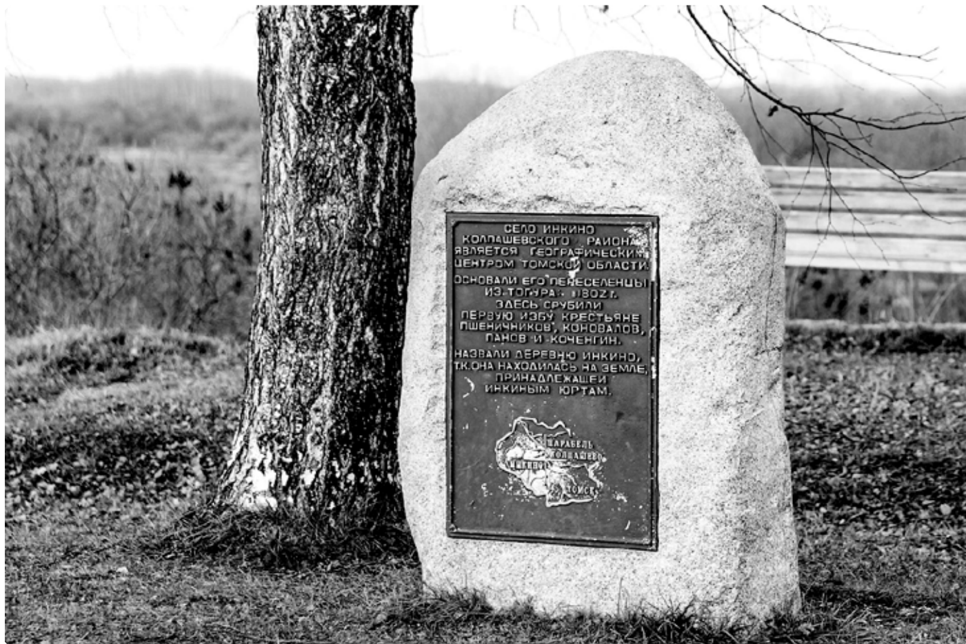
Камень, символизирующий географический центр Томской области. Установлен в 2007 году на берегу реки Шуделька. Село Инкино.

Идти-то надо лесом дремучим, подле речки, узенькой тропинкой. Вот шли-шли мы. Стемнело. Подошли к маленькой избушке. Стоит, завалилась. Заглянули мы в неё, а там лежит мертвец. Мы назад подались. Тут увидели мы огневище, ночевал кто-то, мы и остановились тут. Что делать? Надо дрова таскать, а медведь где-то рядом ломится, да ухает в чашобе. Твори Бог волю свою! Девчата мои чуть не плачут, а я их утешаю: «Не бойтесь! Господь с нами». Ну, ладно. Разожгли огонь и сидим, а медведь ухает, только лес шумит. Вот у нас лица бледнеют и волосы седеют.