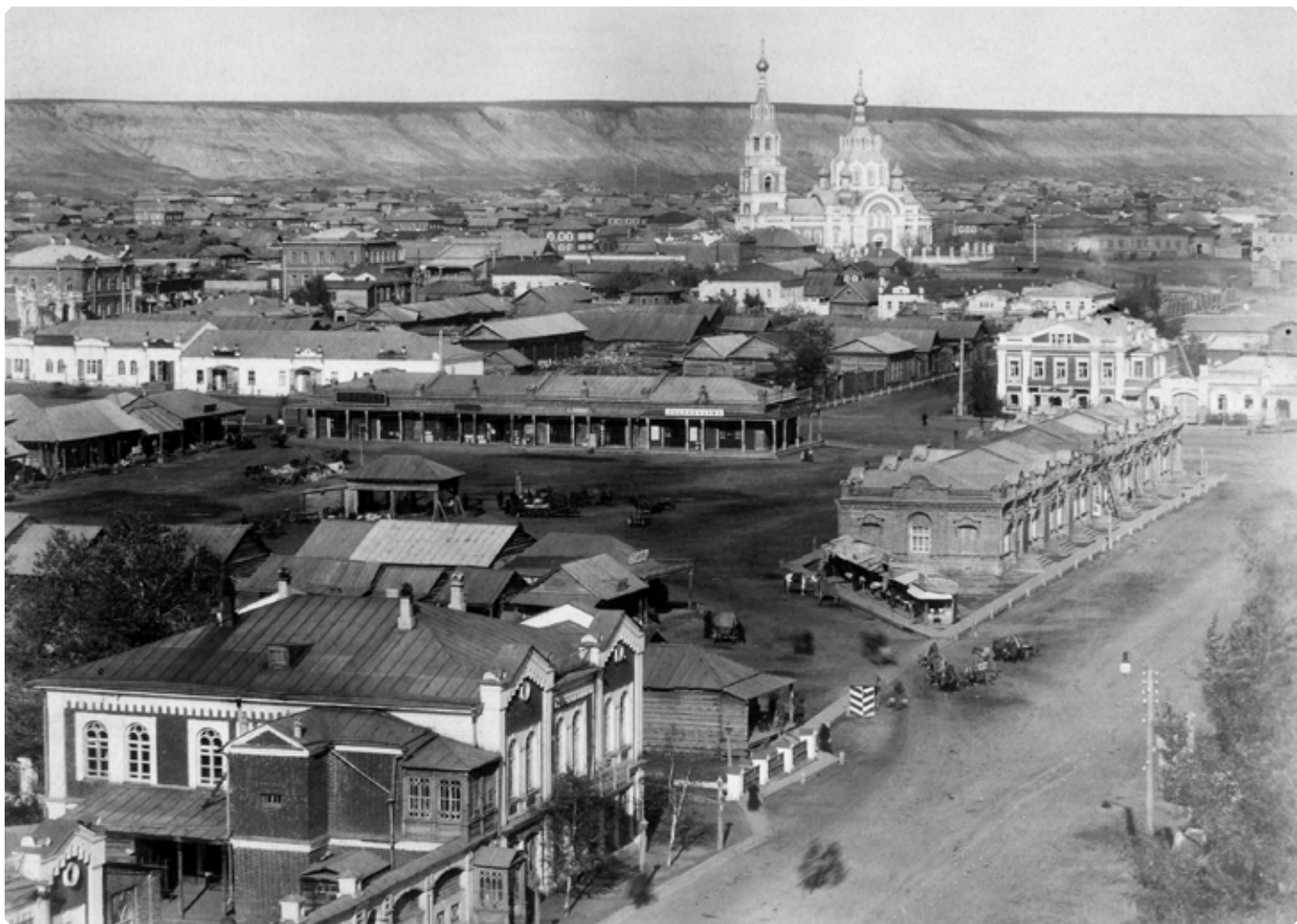
Вид центральной части города Бийска. 1900 г.