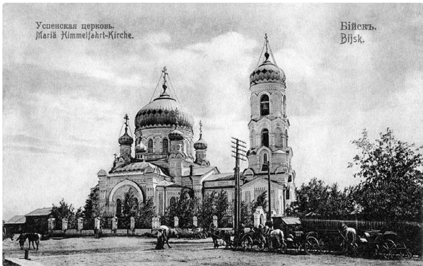
Градо-Бийская Успенская церковь. Почтовая карточка. Начало 1910-х гг. БКМ

других храма Бийской крепости, с одноименными названиями.