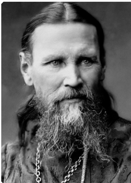
Праведный Иоанн Кронштадтский

«Здоровье и чрево – это те идолы, особенно у людей нынешнего века, от них же и я многогрешный, – для которых мы живем и которым постоянно служим, до пренебрежения делами своего христианского звания, например, чтения Слова Божия, которое слаще меда и сота, молитвы, этой пресладкой беседы с Богом, и составления проповедей Слова Божия. Много гулять для здоровья и для возбуждения лучшего аппетита, есть с аппетитом – вот предметы желаний и стремлений многих из нас. А из-за наших частых прогулок, из-за нашего пристрастия к пище и питью – смотришь: и то упущено не возвратно, и это не сделано, и то на ум нейдет, потому что до серьезного ли дела после вкусного обеда или ужина? И занялся бы делом, да чрево, наполненное пищею и питьем, тянет от него в сторону, к покою нудит; дремлешь за делом. Что же это за дело? Остается только, если после обеда, – лечь отдохнуть, если после ужина, помолвившись кое-как (сытый и молиться не может как должно), – лечь в постель и спать – жалкое последствие отягощения чрева – до будущего утра. А утром, смотришь, опять готова жертва твоему чреву – вкусный чай. Встал, помолился, конечно, не от всего сердца – от всего сердца мы умеем только есть да пить, гулять, романы читать, в театрах сидеть, на вечеринках плясать, в любимых нарядах щеголять – итак помолился по привычке, небрежно, соблюл форму молитвы, одну форму, без сущности,