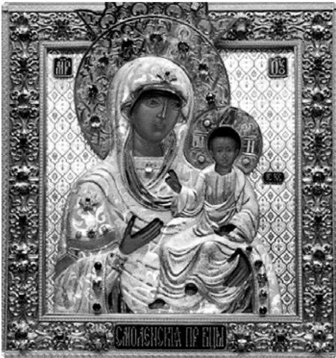
Особо чтимая в Томской губернии икона Божией Матери Одигитрия из села Богородского

Его же Царствию не будет конца, и Дух Святой нас исцелит и укрепит. Кто его просит, Он многомилостлив и терпит до конца. Получила я неведомое чудесное исцеление, шла я с большой радостью и непрестанно благодарила Господа Бога в своей душе.