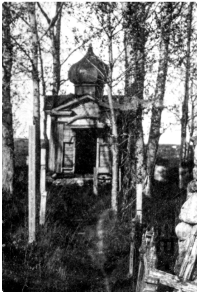
Часовня на Вознесенском кладбище. Город Бийск. 1920-е гг. БКМ

№ 16 Томской епархии, в Петропавловском соборе г. Барнаула, в Сретенской церкви села Бердского, благоч. № 16. С 1895 года служил священником Вознесенского храма в селе Гоньба, благоч. № 20, с 1906 года – в Николаевском храме села Ложкино Бийского уезда и в церкви села Марушки. В русско-японскую войну, с апреля 1904 по февраль 1906 года, был командирован с походным Мариинским храмом в действующую армию, в распоряжение Главноуполномоченного Российского общества Красного Креста. Всё время